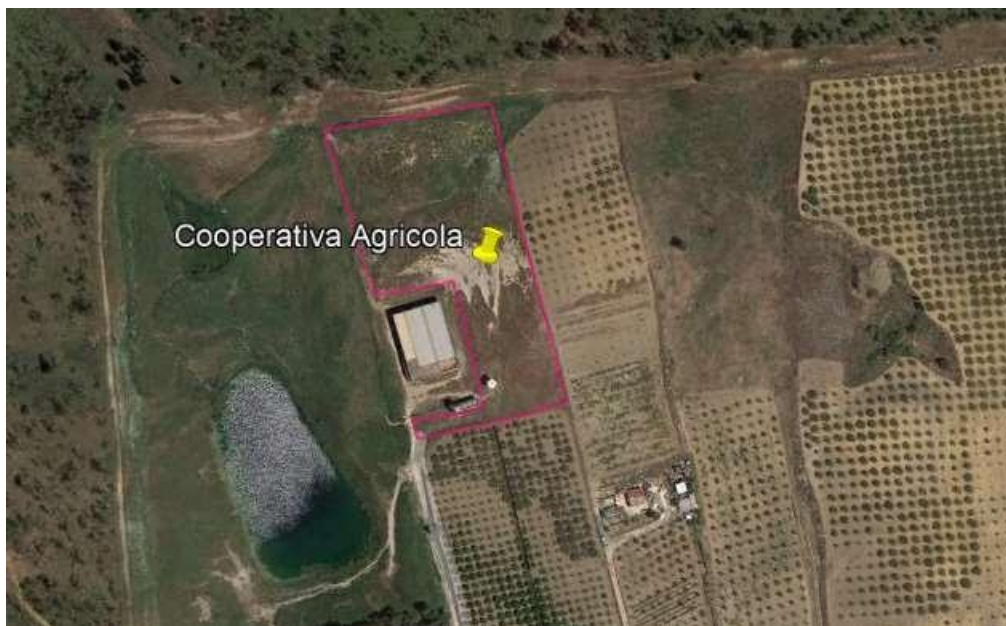
Fig. 3 – Inquadramento satellitare di dettaglio