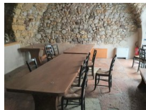
#18: Mobiliario para Restauración - B