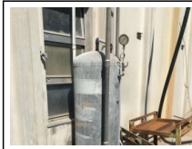
#84: Suavizador de Agua 1000 Litros