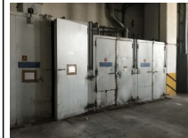
#85: N. 3 Cabinas de Lavado