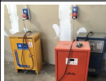
#63: N. 4 Cargadores para Montacargas