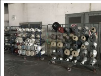
#62: Equipos de Trabajo e Instrumentos de Medición