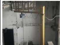
#60: Equipos de Logística - B